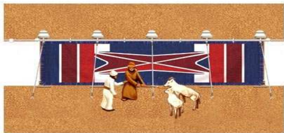
2 verschillende plaatjes (zie hierboven en hieronder) met het ROOD, WIT en BLAUW van de Poort van de Israëlitische Tabernakel