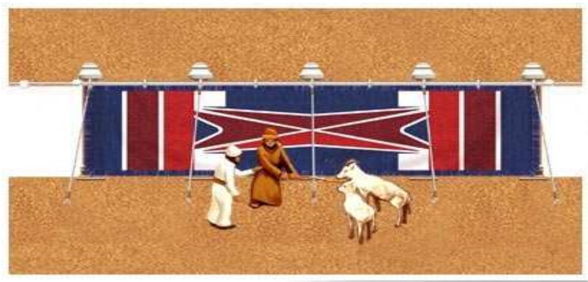
2 verschillende plaatjes (zie hierboven en hieronder) met het ROOD, WIT en BLAUW van de Poort van de Israëlitische Tabernakel

1. Toeval of niet (zelf geloof ik niet in “toeval”), het is toch zeker opvallend te noemen dat de kleuren van veel vlaggen in Europese landen (tevens vaak kustlanden zoals Nederland, Frankrijk, Engeland) maar ook bijvoorbeeld Amerika – waar veel Europeanen in later eeuwen naar toe zijn gegaan – het rood, wit en blauw in hun vlag hebben zitten. Dit zijn kleuren die ook steeds weer terugkomen in de (naar Gods instructies speciaal geweven) gordijnen van de Poort, de Deur en het Voorhangsel van de Tabernakel van Israël (en ook tevens een verwijzing zijn naar het volbrachte werk van Jezus Christus – zie noot 6 en o.a. meer hierover in de studies “ Christus in de Tabernakel ” en/of “ De Tabernakel van Israël ” op onze website www.eindtijdbode.nl ).